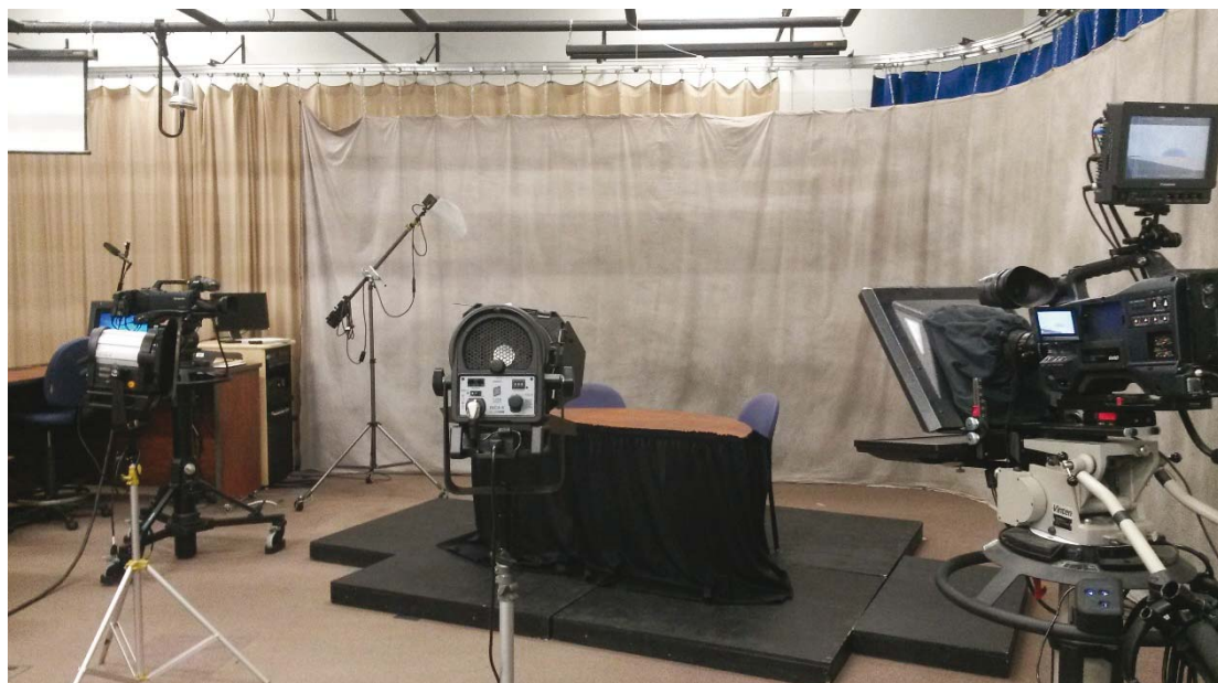
Rysunek 2. Infrastruktura dla prowadzenia wideokonferencji zewnętrznej

Wykorzystanie e-learningu do transmisji spotkań ze znanymi osobami (rys. 2) umożliwi uczestnictwo znacznej liczby zainteresowanych studentów i wykładowców. Możliwie jak najszerszy odbiór wywiadów stanowi istotną składową promocji uczelni i budowania jej marki.